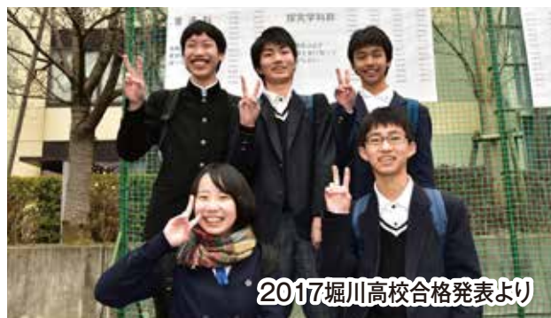
2017堀川高校合格発表より