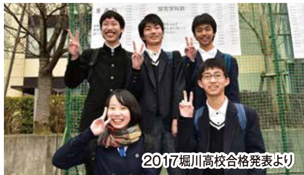
2017堀川高校合格発表より